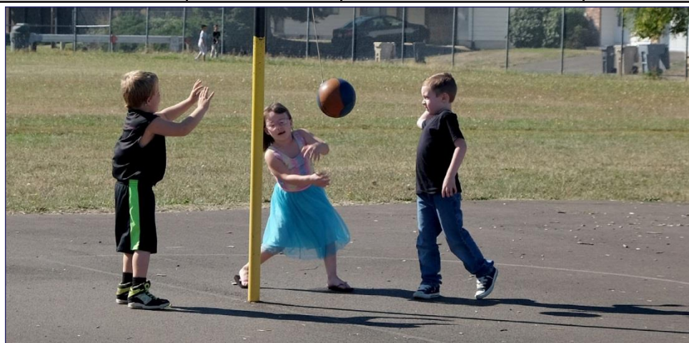
Estudiantes de Sunrise Elementary School disfrutando del tiempo afuera durante el recreo.

Lea en la página 3, sobre la planificación de los proyectos.