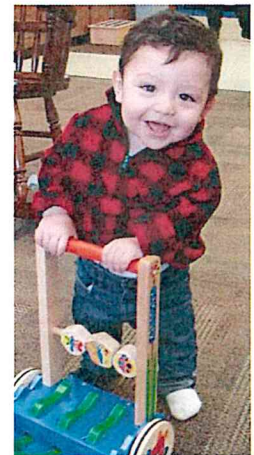
Classes for children ages 0 to 5 years old