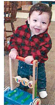
Clase para niños de 0 a 5 años