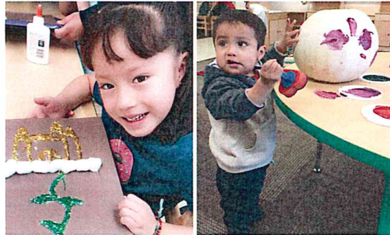
Actividades de Arte